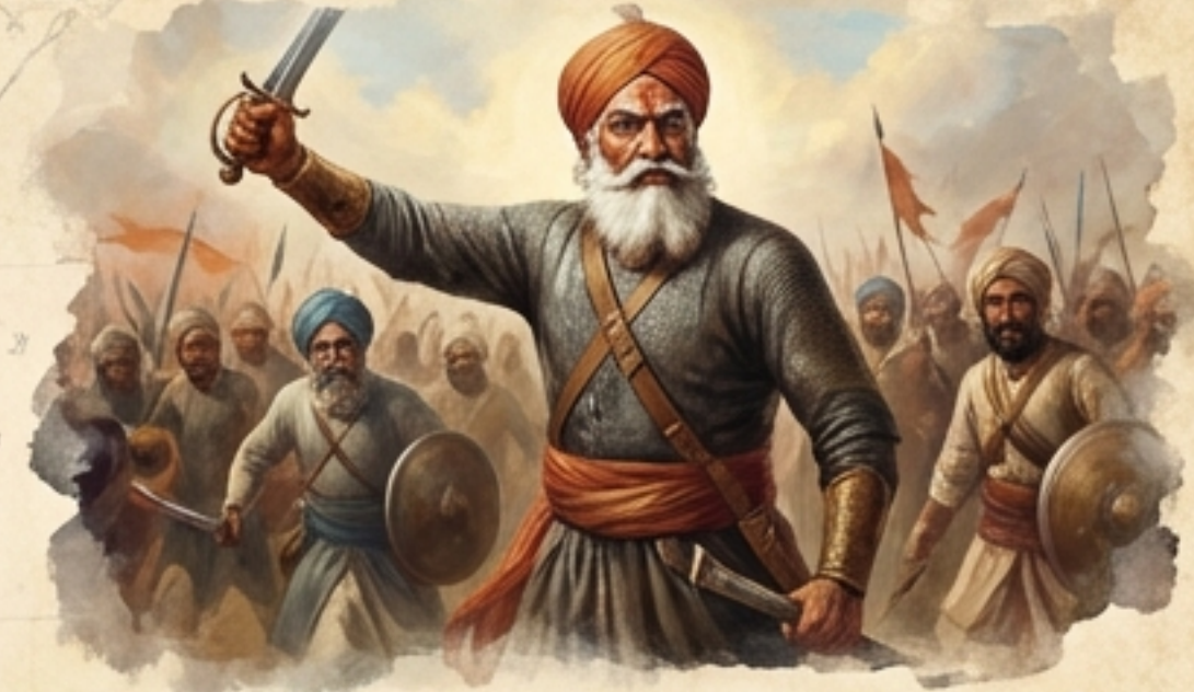
બિહાર: 82 વર્ષના વીર કુંવરસિંહ

અન્ય કેન્દ્રો: બનારસ, આગ્રા, ગ્વાલિયર, ઇન્દોર, અલ્હાબાદ અને બરેલી.