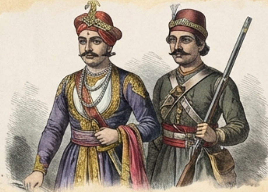
કાનપુર: નાનાસાહેબ પેશ્વા અને તાત્યા ટોપે