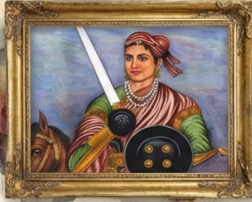
ઝાંસી: રાણી લક્ષ્મીબાઈ