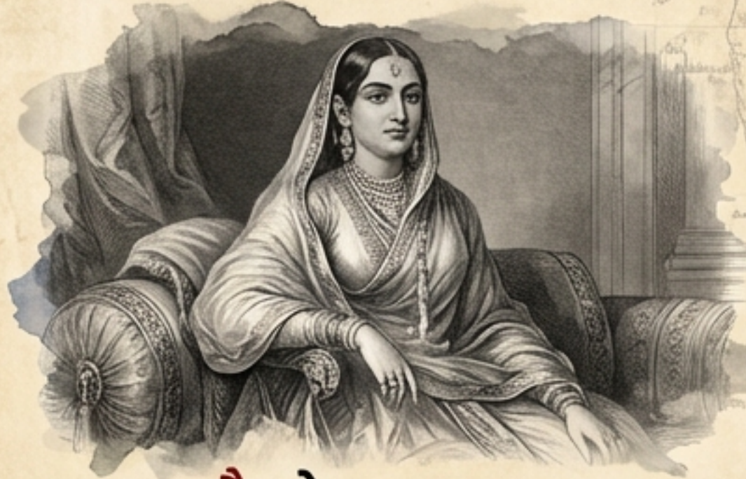
લખનૌ: બેગમ હઝરત મહલ